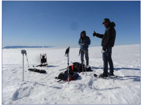
Iskappen v/ Qaanaaq 2020

Asiaq løste en opgave for Hokkaido University, Japan på iskappen på Qaanaaq halvøen. Hokkaido University's projekt: "Stake measurements on Qaanaaq Glacier" havde brug for hjælp pga. Coronasituationen.