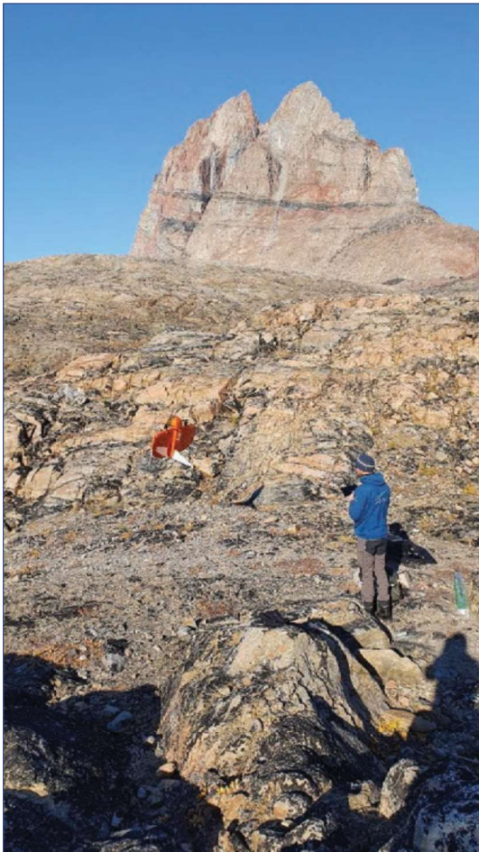
Klargøring til droneflyvning i Uummannaq 2020

I 2020 ajourførte Asiaq grundkortet for 20 byer og bygder – mere præcist alle lokaliteter på strækningen fra Kapisillit og nordover til og med Uummannaq. Af Coronarelaterede sparehensyn blev ajourføringen af Qasigiannqut, Qeqertarsuaq samt Upernavik længere nordpå udsat til 2021. Et særligt kendetegn for 2020 var test og udvikling af et nye dronebaseret kortlægningskoncept, hvor størstedelen af ajourføringen foregår vha. fotografering fra Asiaqs nyindkøbte Wingtra One professionelle drone. Dronekonceptet øger effektiviteten og kvaliteten af grundkortajourføringen, bl.a. fordi højdemodel og ortofoto, i modsætning til tidligere, er en del af pakken. Droneflyvning blev gennemført på 17 af de 20 lokaliteter, og det demonstrerer, at luftbåren ajourføring er mere følsom for vejr og sigtbarhed end den traditionelle landbaserede opmåling.