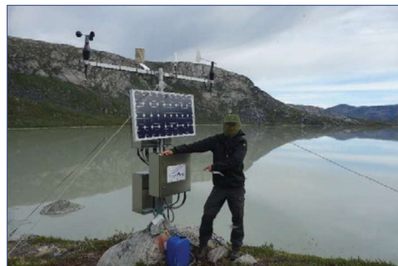
Hydrologisk station, Kuussuup Tasia 2020

Alle hydrologiske målestationer på nær én blev serviceret i 2020. Departementet for Erhverv og Nukissiorfiit er de vigtigste interessenter; men også kommercielle spillere samt forskningsmiljøer værdsætter de lange tidsserier.