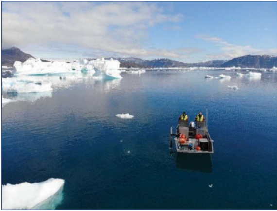
Bathymetri ved Qeqertaq, Diskobugten 2020

Bathymetri – dybdemålinger og kortlægning over vand – med fokus på lavvandede områder og søer, er en ydelse, som Asiaq har specialiseret sig i. Afhængig af opgaven måles der såvel med multi- som single-beam sonar (ekkolod). I 2020 har Asiaq bl.a. kortlagt havet ud for Saqqaq og Qeqertaq i Diskobugten for GEUS Screeningsprojekt, råvandssøer i Ilulissat, sejladsadgang til 6-7 drikkevandspotentialer i samarbejde med GEUS samt for Nuuk Havn.