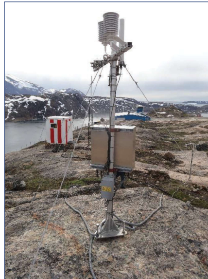
Vejrstation, Upernavik Lufthavn 2020

I 2020 blev et reduceret serviceprogram for vejrstationer pga. Corona situationen og heraf afledte besparelser gennemført. Upernavik og Qaanaaq målestationerne blev prioriteret.