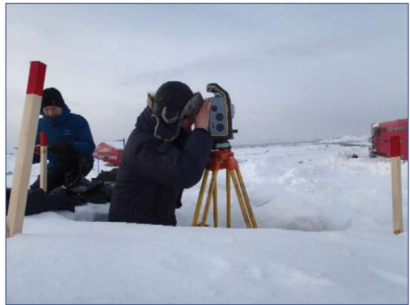
Opmåling til referencenet, Nuuk lufthavn 2020

I 2020 afleverede Asiaq et referencenet for den nye lufthavn i Nuuk, opmålt, afmærket og beregnet for Kalaallit Airports. Asiaq bød på en tilsvarende opgave for Ilulissat lufthavn; men fik den desværre ikke.