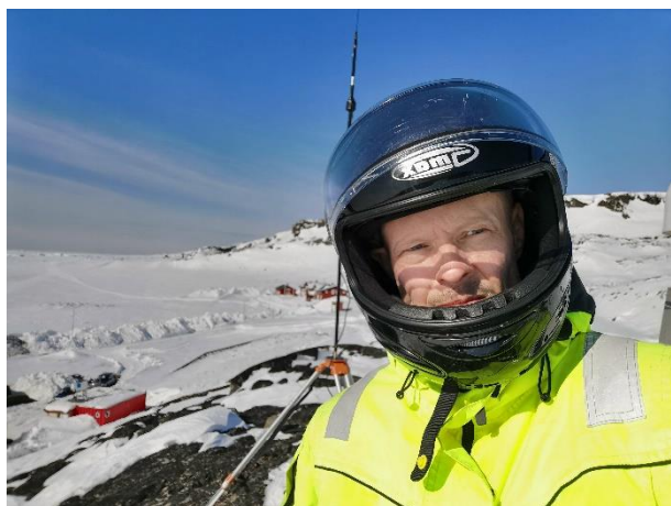
Feltarbejde ved GNSS-basen i Qeqertarsuaq.

Afdelingen Geodata & Kortlægning rapporterer for Grundkort & Referencenet, Geografisk Infrastruktur og nationale strategier samt Byggepladser & Forundersøgelser . Afdelingen for Hydrologi, Klima & Miljø (HKM) rapporterer for Hydrologiske forundersøgelser; Vejr- & klimaobservationer samt Forskning & monitorering . Afsnittet midt i om Field Services er et fælles anliggende.