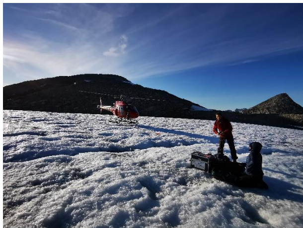
Monitering af iskappe, GlacioBasis, Kobbefjorden, Nuuk.

HKM er en del af GIOS-projektet. GIOS finansierer en udvidelse af den nuværende monitoringsinfrastruktur over de næste 2 år for de GEM relaterede aktiviteter i HKM.