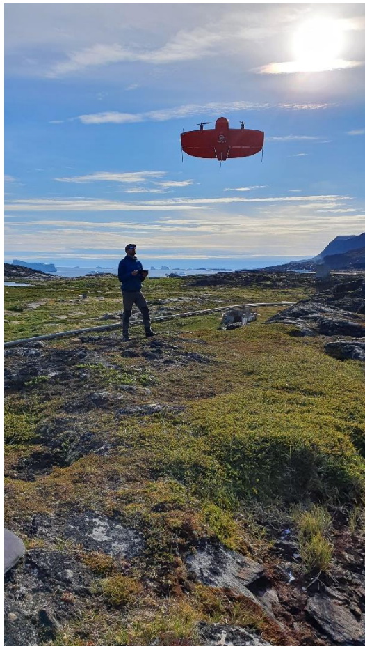
Klargøring til dronedeflyvning, Qeqertarsuaq.

medarbejder blev besat fra 1. august 2021.