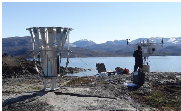
Tilsyn af hydrologisk station #493 øst for Qeqertarsuaat.

For kommercielle kunder driver Asiaq yderligere 3 hydrologiske stationer i forbindelse med forundersøgelser for vandkraft ved andre vandkraftpotentialer.