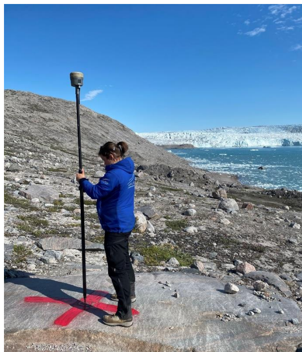
Field Services: måling af paspunkt, Ilulissat Isfjord.

Asiaq tilbyder at servicere og vedligeholde deres infrastruktur. Vi kalder det Field Services .